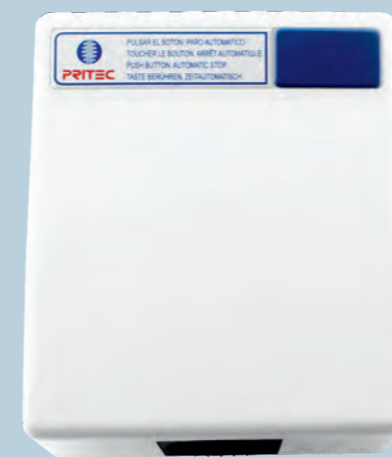
SI2101S Sensor (Pulsador)