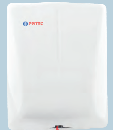
SI2105X Radar Styl