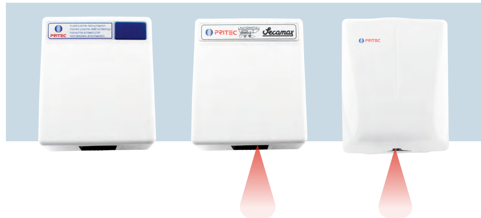
SI2105X Radar Styl