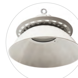
Reflector opcional bajo demanda