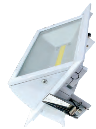
PFA3530 - PFA3545