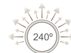
Ángulo de iluminación de 240° 240° illumination angle